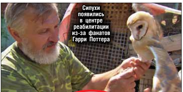
Сипухи появились в центре реабилитации из-за фанатов Гарри Поттера