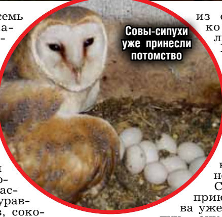
Совы-сипухи уже принесли потомство

из сов, их легко опознать по лицу-сердечку. Но и самые уязвимые — они обитают на юге, в России встречаются только вблизи Черного моря. Зимой им ни под Москвой, ни под Тверью не выжить.